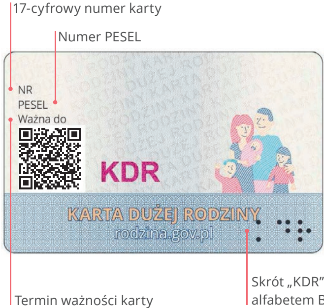
Termin ważności karty